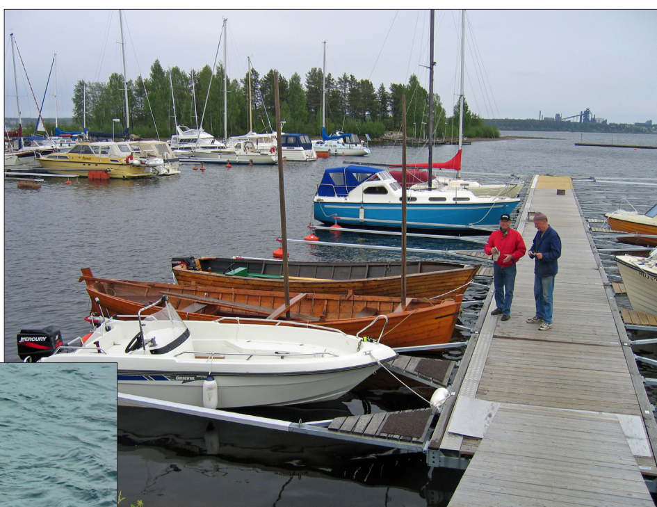
Platserna 502 och 505 på brygga 3 disponeras av Allmogebåtar. Ove Skoog och Lars-Gunnar Boman.