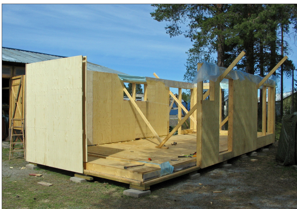
Detta skall bli en bastu.