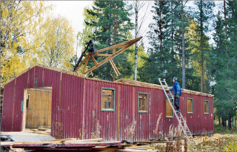
I juli köper vi en gammal militärbarack i Boden. Rolf Westergaard övervakar rivningen.