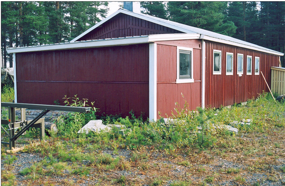
Den nya tillbyggnaden.