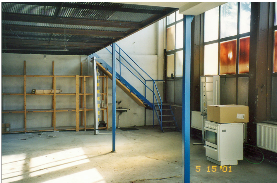
Enligt kontraktet är lokalen 80 kvadratmeter stor och lämplig för båtbyggeri.