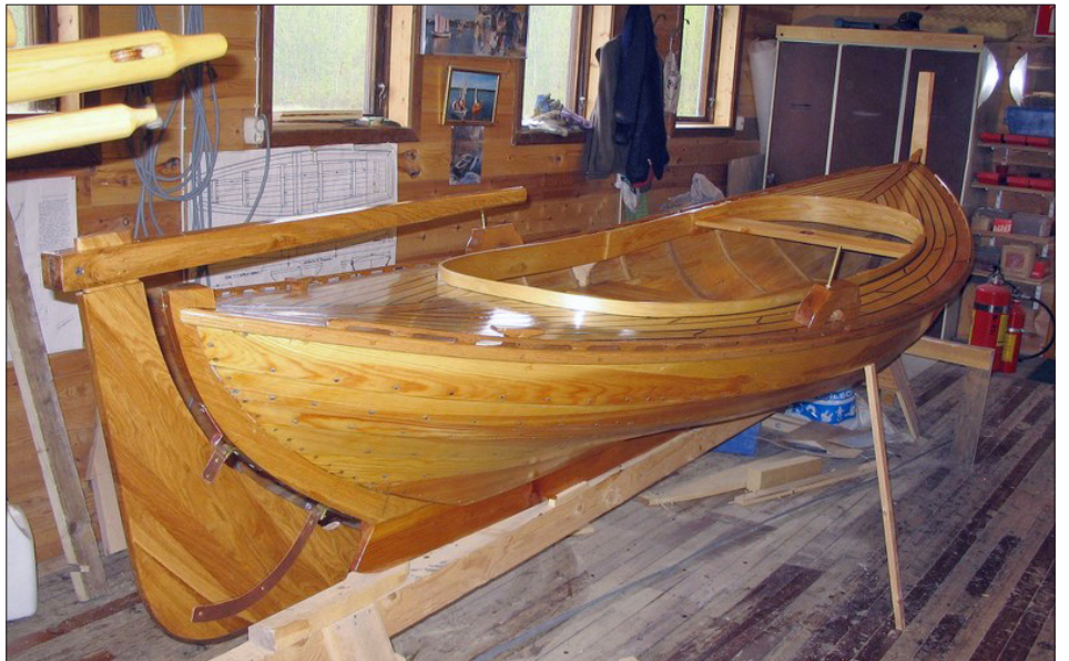
Ytbehandlad och nästan klar. Jaktkanot I.