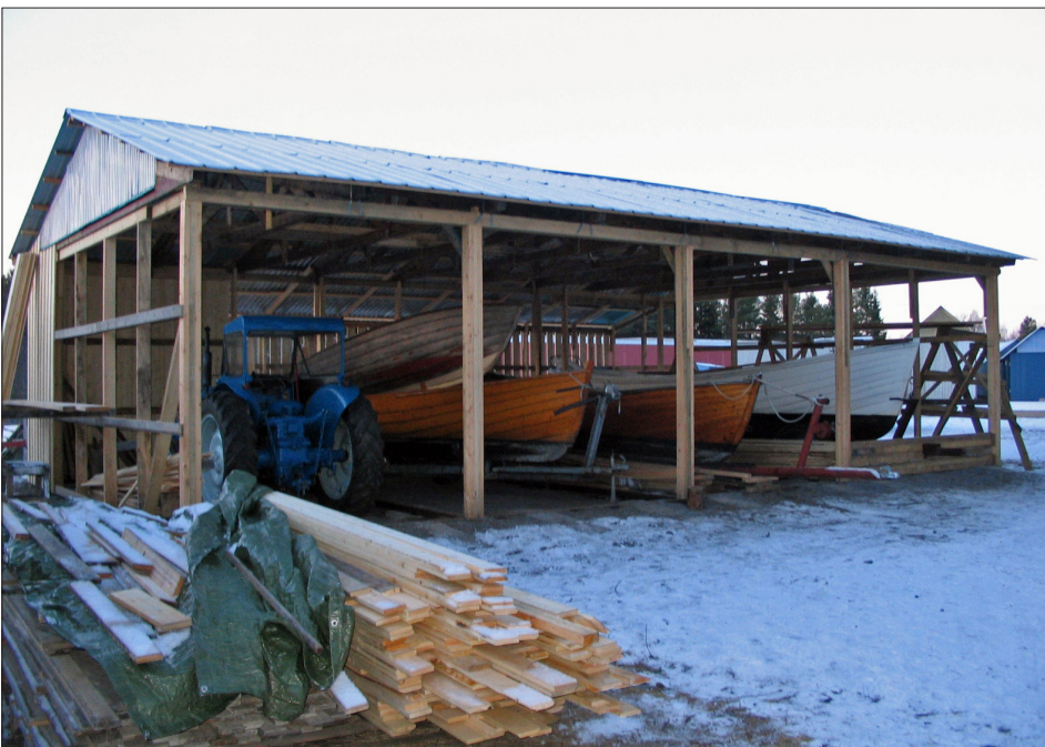
I mitten av november ställs båtarna under tak.