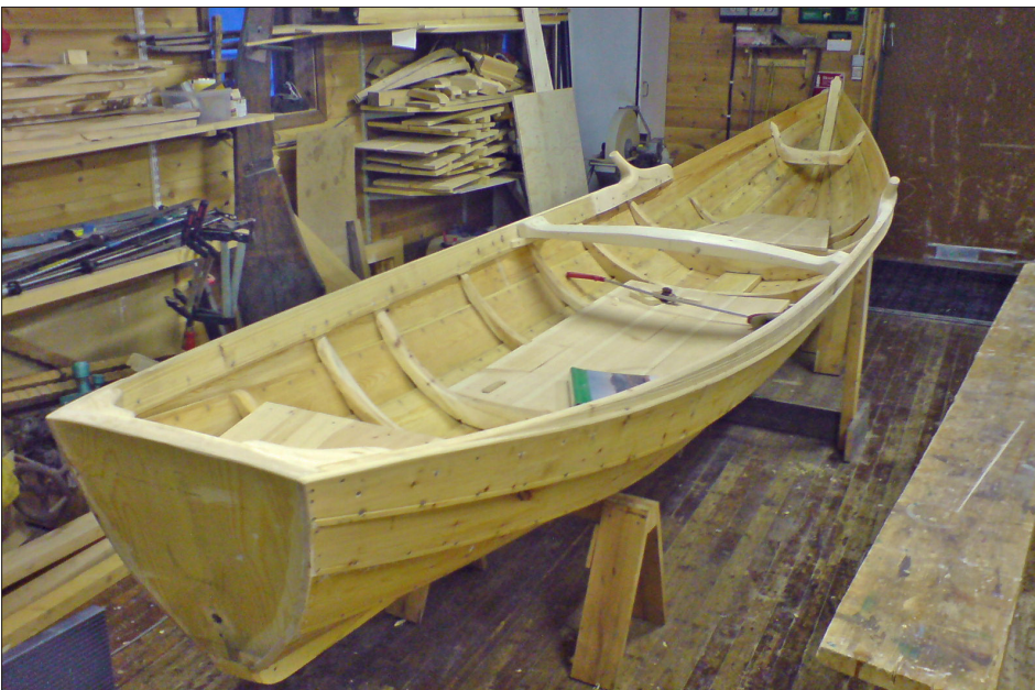
I december är forsbåten klar för ytbehandling.