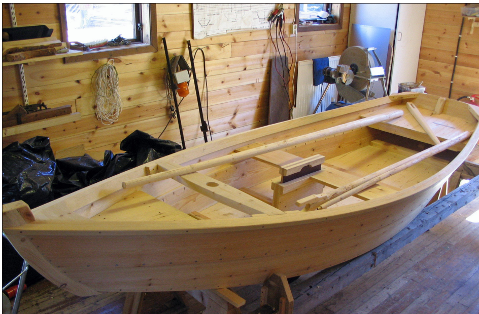
En "Viklundare" med centerbord byggs för Luleå Miljöskolas räknig.