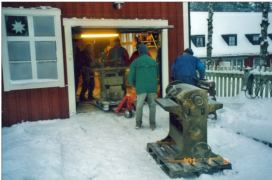
I januari köper vi begagnade maskiner från Englunds Snickeri på Bergnåset. De tas de ned och transporteras till förråd tills vidare.