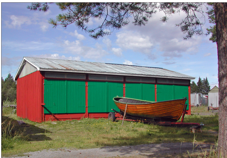
Den 17 augusti är båthuset äntligen färdigmålat.