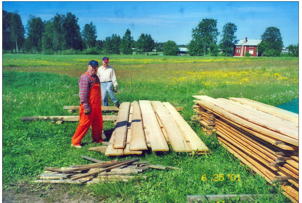
Börje Nilsson och Göran Viklund staplar bordbräder i Brändön.