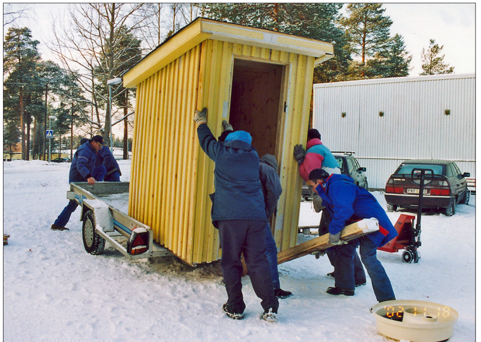
Hemlighus på väg till Granudden. Många hjälpsamma händer. Ingen nämnd och ingen glömd.