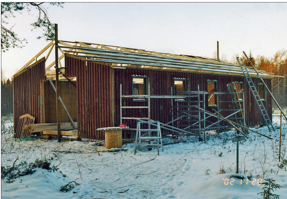
I november är väggarna resta och de nya takstolarna på plats.