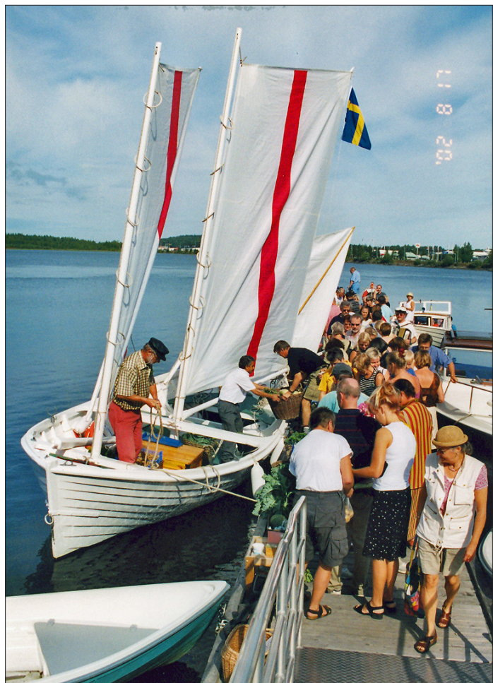
Grönsaker till salu! Full kommers på bryggan.