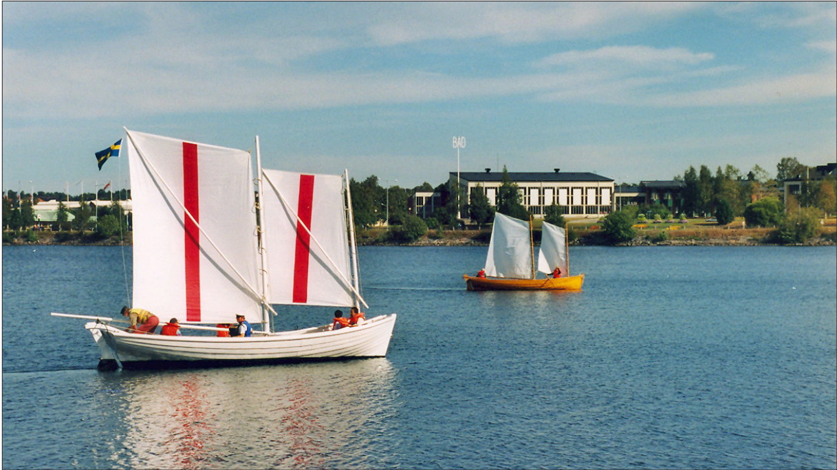
"Grönsakssegling" den 17 augusti. Vi fraktar kravodlade grönsaker från Gäddvik till Norra hamnen. Lotsbåten och Eulalia på Stadsviken.