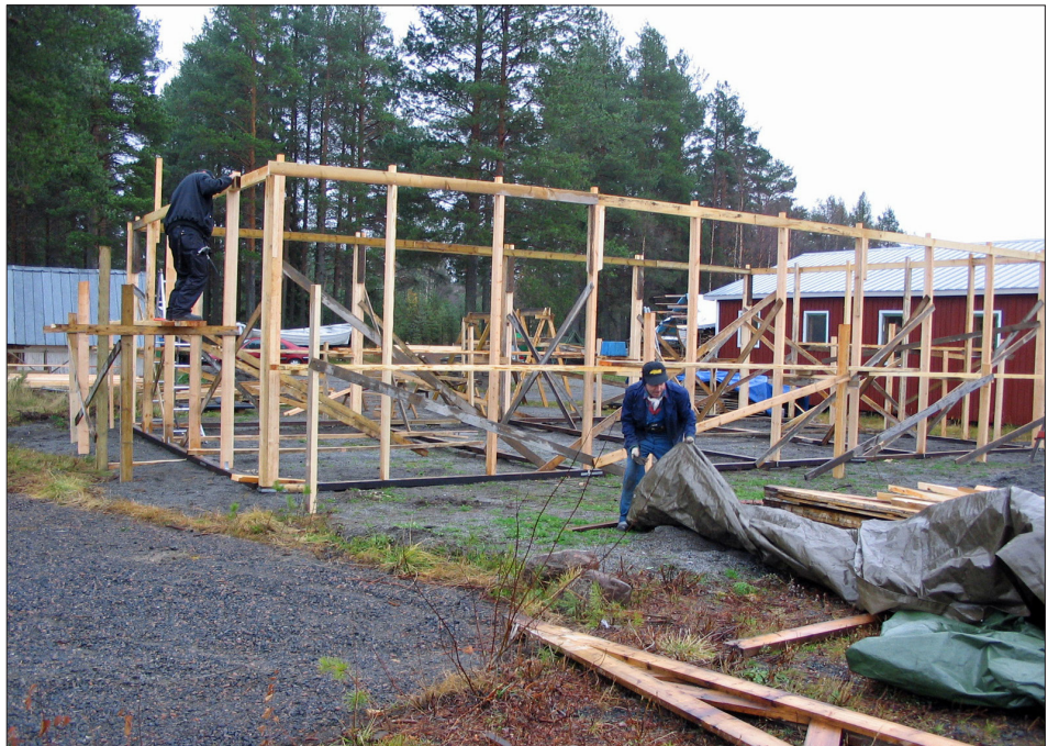
Under hösten börjar även ett båthus att byggas. Byggjobbare är Olavi Kuusela och Sven Eliasson.