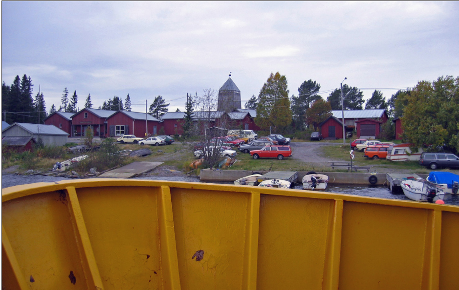
Utflykt till Holmöns båtmuseum den 1 oktober. Museet från färjan.