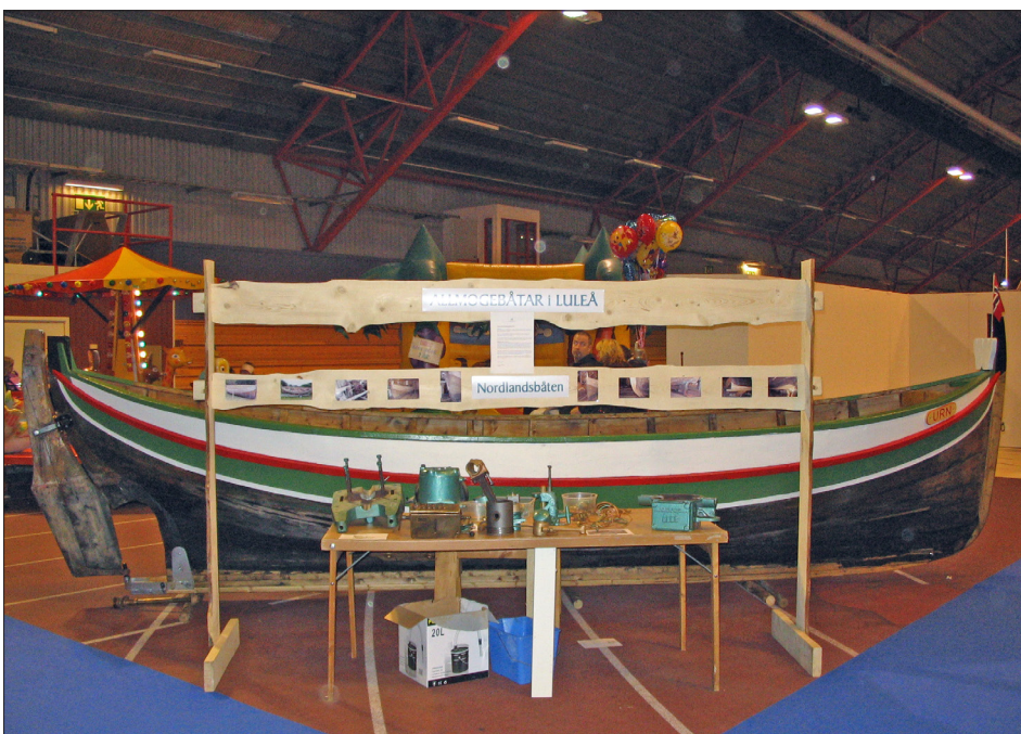
Vårmässa i Arcushallen 4–6 maj. Nordlandsbåten med SABB-motorn i delar framför.