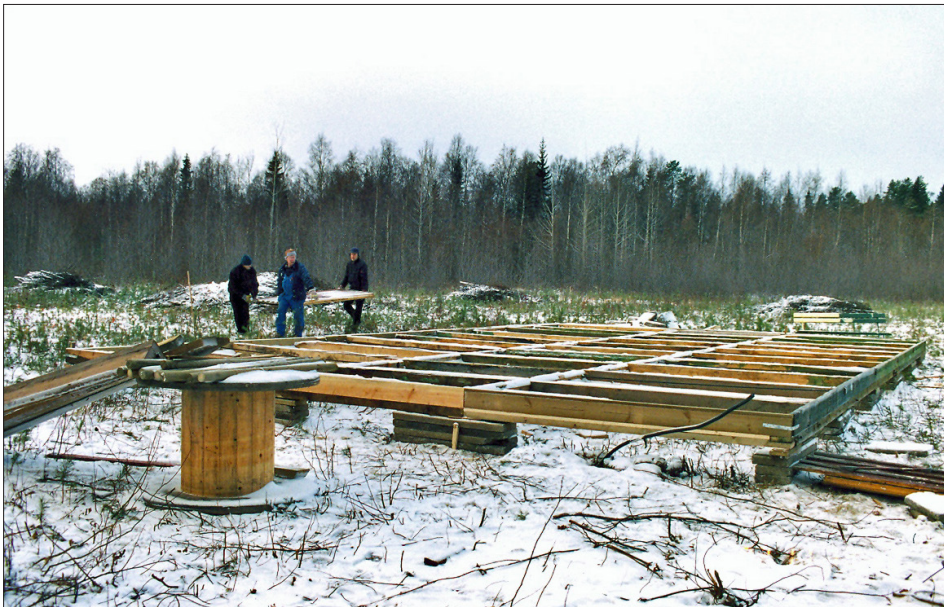
Syllen läggs till vårt nya båtbyggeri på Granudden. Personal från friluftsmuseet Hägnan utför arbetet.